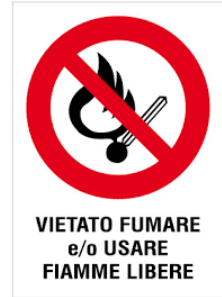
VIETATO FUMARE e/o USARE FIAMME LIBERE

L'incendio è la combustione (reazione chimica di un combustibile con un comburente in presenza di innesco) sufficientemente rapida e non controllata che può svilupparsi senza limitazioni nello spazio e nel tempo. Il rischio di incendio è sempre presente in qualsiasi attività lavorativa.